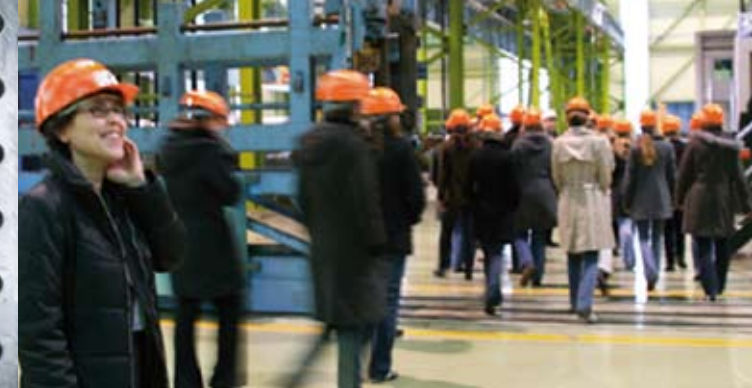
Ein Femtec-Kurs auf Exkursion

Sie studieren Ingenieur- oder Naturwissenschaften? Sie sind in Ihrem Studium erfolgreich und wollen Ihre Karriere aktiv gestalten? Dann bewerben Sie sich für das Careerbuilding- Programm der Femtec!