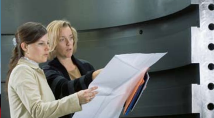
Ingenieurinnen der Siemens AG