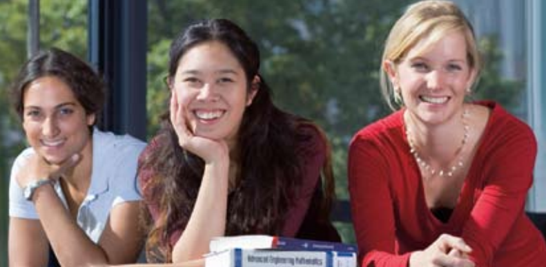
Femtec-Studentinnen an der TU Berlin